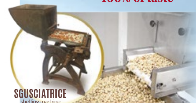
SGUSCIATRICE shelling machine

Disponibili nei calibri / Size available 2/4 - 3/5 - 5/8 - 8+ mm. Disponibili nei calibri / Size available 2/4 - 3/5 - 5/8 - 8+ mm.